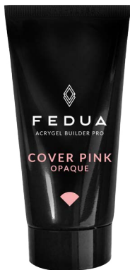
COVER PINK 4004