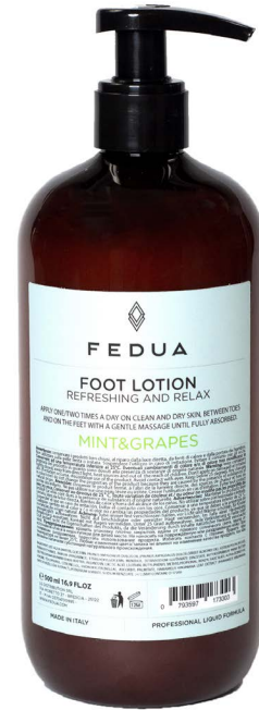
FOOT LOTION 500 ml