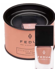
SAFARI ROSE 0008