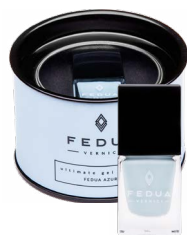
FEDUA AZURE 0001