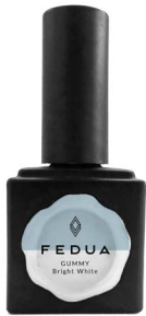
GUMMY BRIGHT WHITE 2850