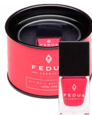
CORAL PINK 0011