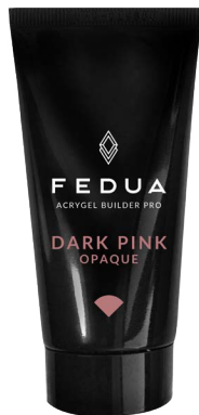
DARK PINK 4005