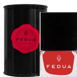
MINISIZE CLASSIC RED