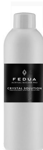
CRYSTAL SOLUTION 200 ml