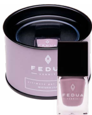
WISTERIA LILAC 0006