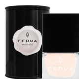
MINISIZE WATER ROSE