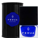
MINISIZE ELECTRIC BLUE