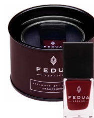
MARASCA ROUGE 0003