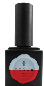
GUMMY SCARLET 2865