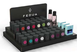
MINI SIZE DISPLAY

Large display Gel Effect Line, Vernici collection, elegant design. Black cardboard.