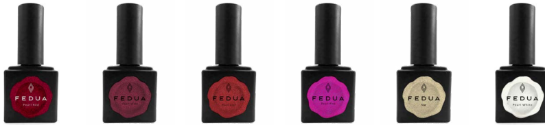
PEARL RED 2015 PEARL WINE 2048 PEARL LUST 2049 PEARL PINK 2050 STAR 2042 PEARL WHITE 2005