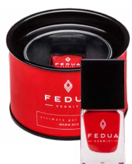
WARM RED 0009