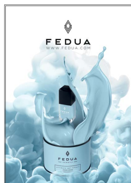
BIG WINDOW SIGN

Small Gel Effect Line Display, Vernici collection. Black cardboard.