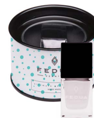
WATER WHITE 0024