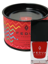
CLASSIC RED 0026