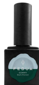
GUMMY DARK FOREST 2857