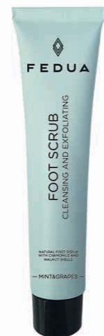
FOOT SCRUB CLEANSING AND EXFOLIATING 3902