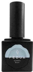
GUMMY BLACK 2851