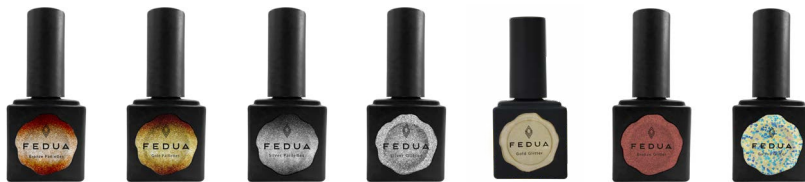
BRONZE PAILLETES 2060 GOLD PAILLETES 2059 SILVER PAILLETES 2061 SILVER GLITTER 2000 GOLD GLITTER 2020 BRONZE GLITTER 2080 GALAXY GLITTER 2083