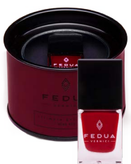
WINE RED 0018