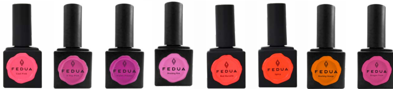
COOL PINK 2016 IF YOU PINK 2008 VIOLET FLOWER 2014 SHOCKING PINK 2043 RED BANANA 2022 SPICY 2024 SHOCKING ORANGE 2034 DRAGON FRUIT 2085