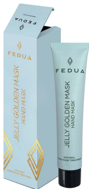
JELLY GOLDEN MASK 3000