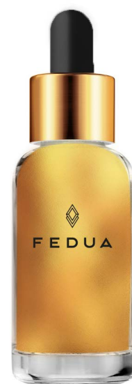
JELLY GOLDEN SERUM 3001