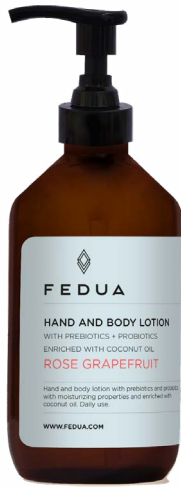
HAND AND BODY LOTION ROSE GRAPEFRUIT 3501