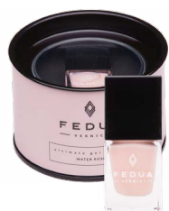
WATER ROSE 0016