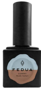
GUMMY NUDE SAFARI 2854