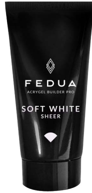
SOFT WHITE 4002