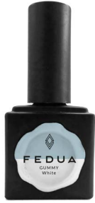
GUMMY WHITE 2820