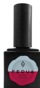
GUMMY POPSICLE 2866