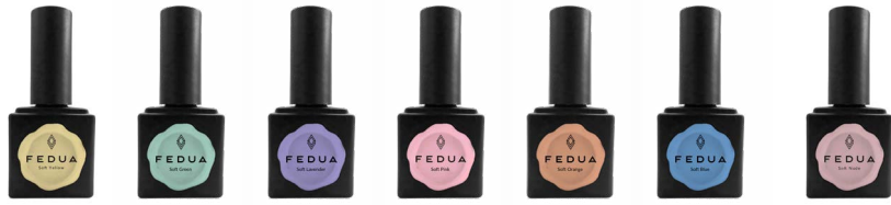
SOFT YELLOW 2073 SOFT GREEN 2035 SOFT LAVENDER 2036 SOFT PINK 2038 SOFT ORANGE 2037 SOFT BLUE 2033 SOFT NUDE 2074