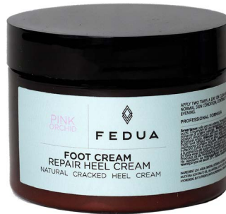
FOOT CREAM REPAIR HEEL 250 ml