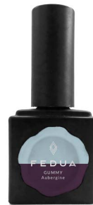
GUMMY AUBERGINE 2859