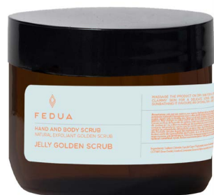
JELLY GOLDEN SCRUB 3002