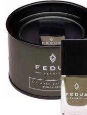
POISON GREEN 0007