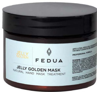
JELLY GOLDEN MASK 250 ml