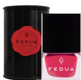
MINISIZE CORAL PINK