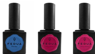
POSH BLUE 2032 POSH ROUGE 2010 POSH VIOLET 2009