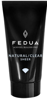
NATURAL CLEAR 4003