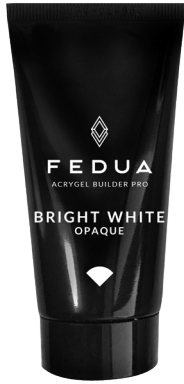
BRIGHT WHITE 4001