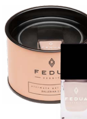
BALLERINA 2.0 0033