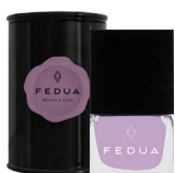
MINISIZE WISTERIA LILAC