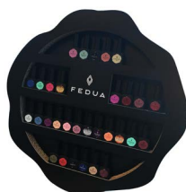
GEL POLISH DISPLAY

Display for Mini Size Kit. Black cardboard.