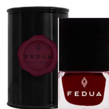
MINISIZE MARASCA ROUGE