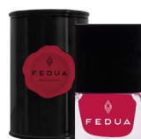
MINISIZE RED CHERRY