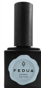
GUMMY TOP COAT 2801