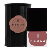
MINISIZE NUDE SAFARI