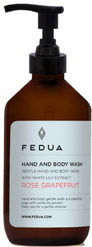
HAND AND BODY WASH ROSE GRAPEFRUIT 3502