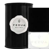
MINISIZE WATER WHITE