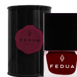
MINISIZE WINE RED