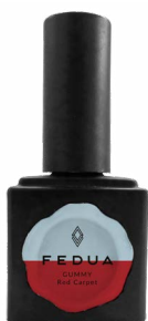
GUMMY RED CARPET 2862