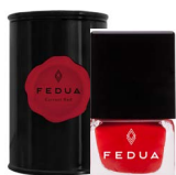
MINISIZE CURRANT RED