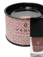
NUDE SAFARI 0027