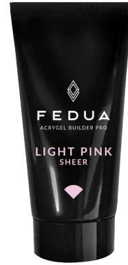
LIGHT PINK 4006