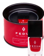
CURRANT RED 0002