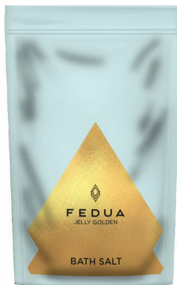
JELLY GOLDEN BATH SALT 3003