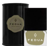
MINISIZE POISON GREEN