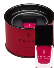
RED CHERRY 0021