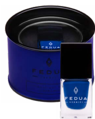
ELECTRIC BLUE 0019