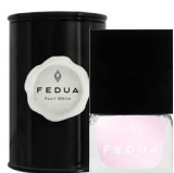
MINISIZE PEARL WHITE